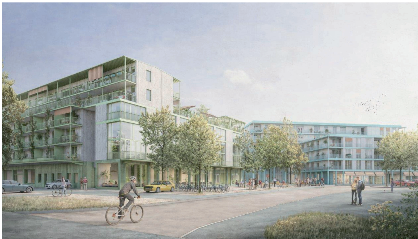
Visualisierung Perspektive Stationsstrasse