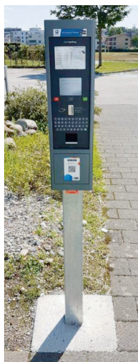
Verschoben auf neue Legislaturperiode – Neues Parkierungskonzept auf öffentlichem Grund

Bei der Festlegung seiner strategischen Zielsetzungen hat der Gemeinderat im Jahr 2023 den Fokus bewusst über die Legislaturperiode hinaus gerichtet, vorerst bis ins Jahr 2030. Aus verschiedenen Gründen konnten verschiedene im Jahr 2023 anvisierte Massnahmen noch nicht lanciert oder in der gewünschten Intensität bearbeitet werden. So werden beispielsweise die Erneuerung des Parkregimes auf öffentlichem Grund oder die Aufbereitung von Entwicklungsstrategien für gewisse Dorfteile erst in der nächsten Legislaturperiode konkretisiert. Die Aktualisierung des Gesamtverkehrskonzepts, die Aufbereitung eines Kulturkonzepts, die Förderung von Freiwilligenarbeit oder Massnahmen zum Ausbau der ökologischen Infrastruktur sind weitere Themen und Projekte, welche der Gemeinderat in der neuen Legislaturperiode weiterentwickeln wird.