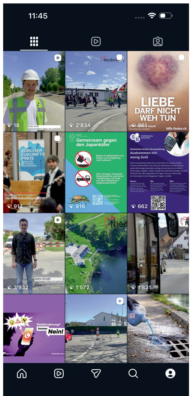
Beiträge Gemeinde Niederhasli

Mit der Einführung des digitalen Dorfplatzes «Crossiety» wollte der Gemeinderat der Bevölkerung eine weitere digitale Kommunikations- und Vernetzungsplattform zur Verfügung stellen. Ziel war es, den Austausch innerhalb der Bevölkerung mit ihren aktiven Dorfvereinen und Institutionen zusätzlich zu fördern. Da das angestrebte Ziel von insgesamt 1500 registrierten Nutzerinnen und Nutzern trotz umfangreicher Kommunikations- und Werbemassnahmen nicht erreicht werden konnte, wurde der digitale Dorfplatz nach der auf drei Jahre ausgelegten Testphase wieder eingestellt.