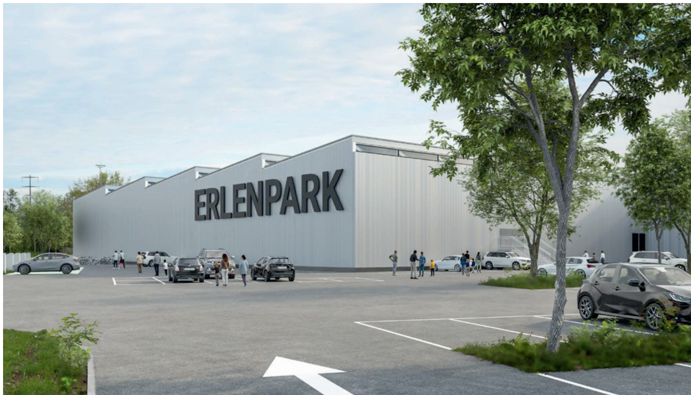
Visualisierung Eishalle Erlenpark