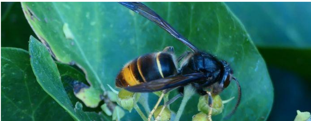
Asiatische Hornisse

Unterscheidungsmerkmale zwischen der Asiatischen und der Europäischen Hornisse. Besonders gut zu erkennen ist die Asiatische Hornisse an der mehrheitlich schwarzen Körperfärbung und den gelben Beinen.