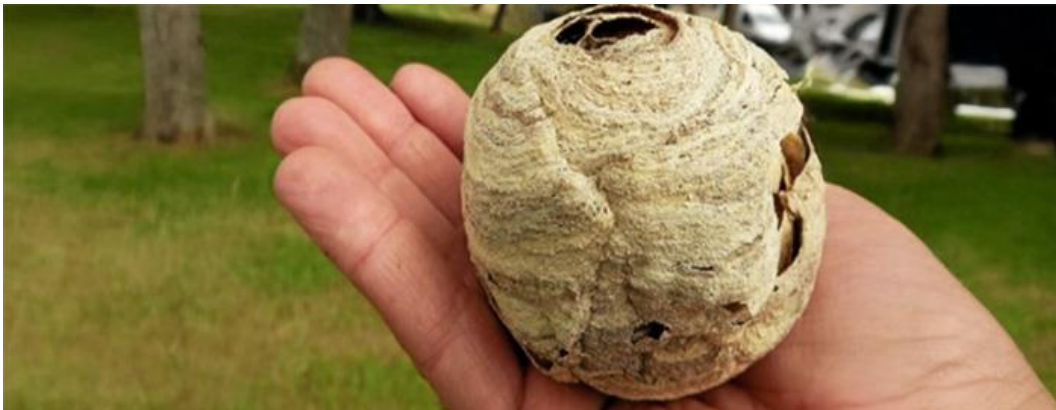
Primärnest Asiatische Hornisse

ACHTUNG! Primärnester am Haus etc. sollten unbedingt professionell entfernt werden, es besteht Verletzungsgefahr.